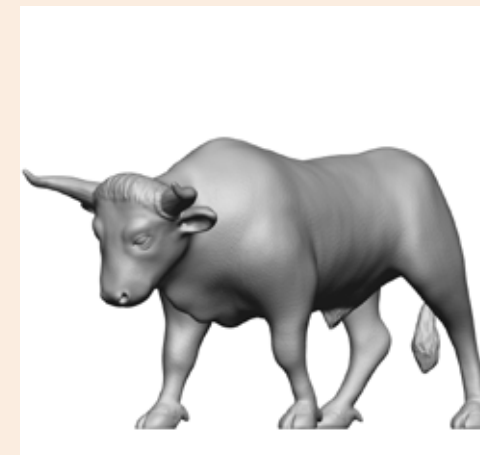
Ochse Olaf Art. 400023