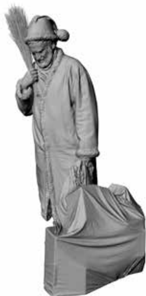
Niko Klaus Art. 480013