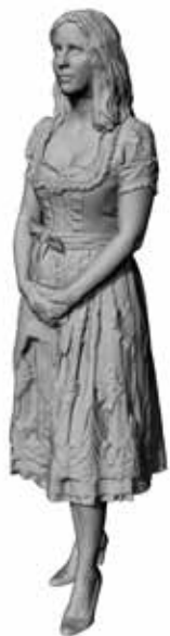
Charmante Carmen Art. 480192A