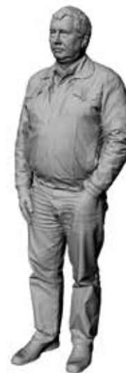
Modischer Martin Art. 480176A / 480176B