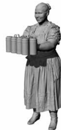
Bedienung Beate Art. 480201A