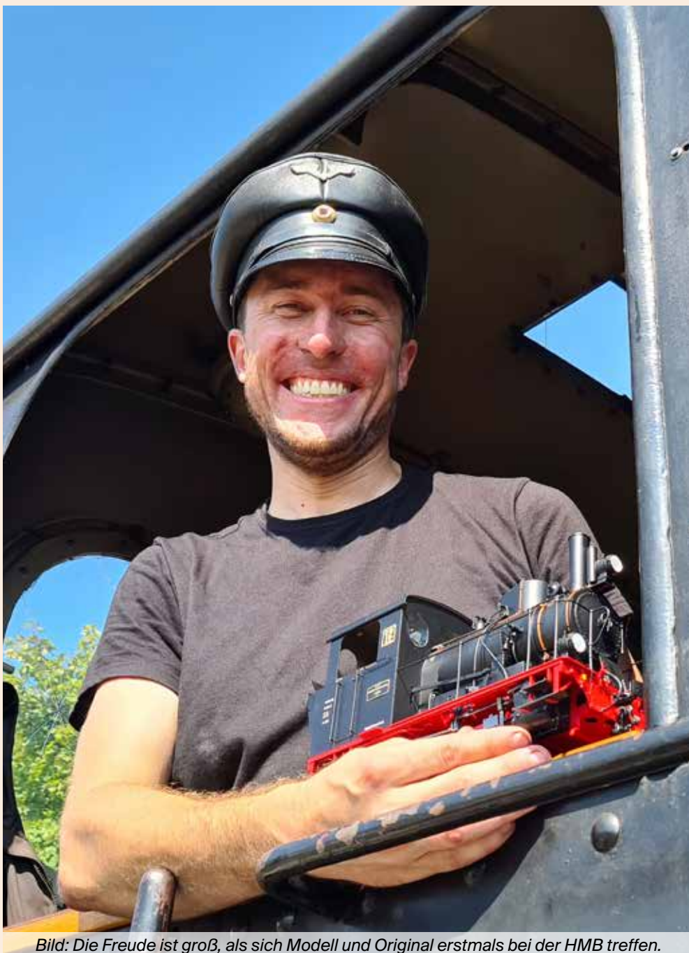
Bild: Die Freude ist groß, als sich Modell und Original erstmals bei der HMB treffen.