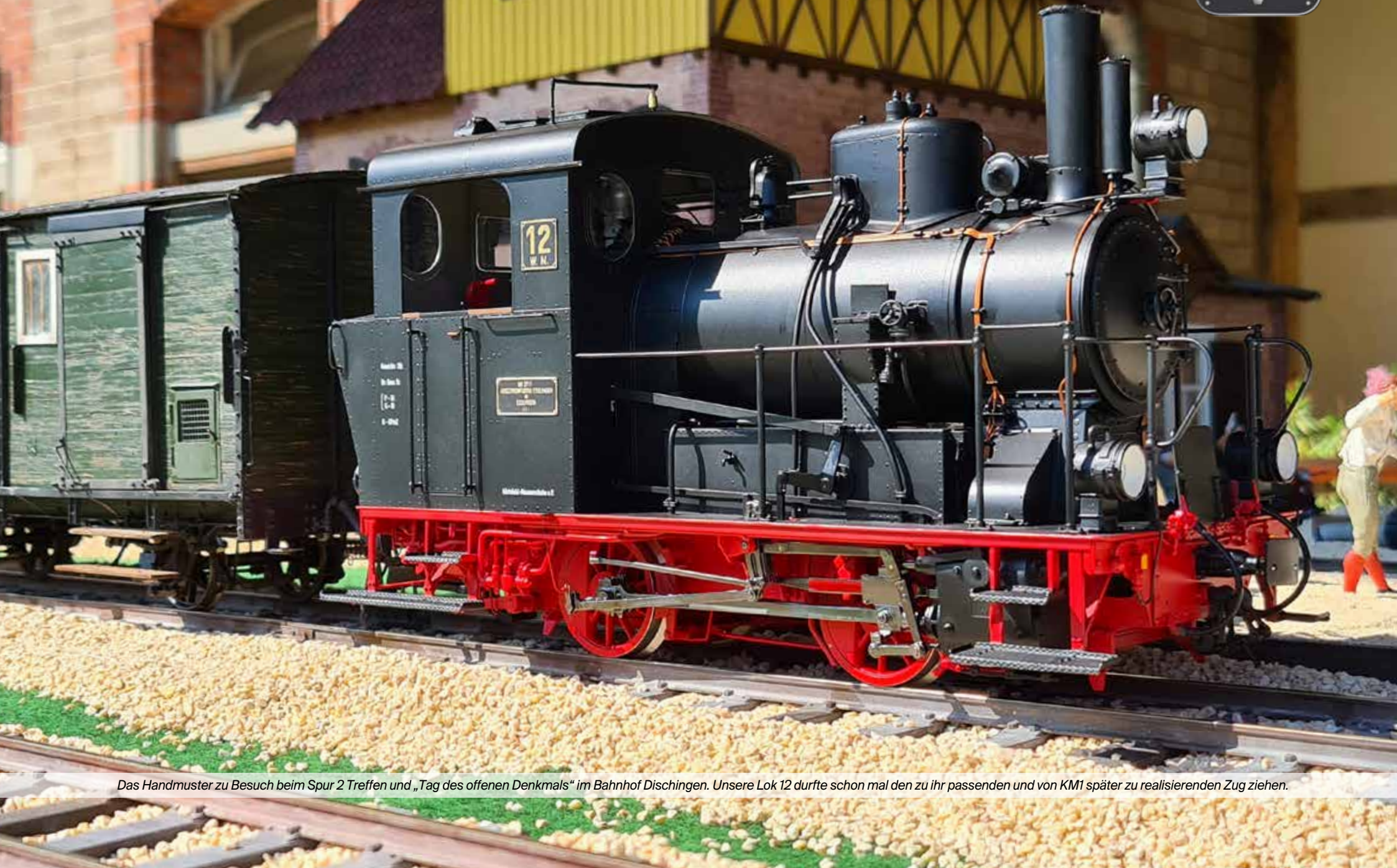
Das Handmuster zu Besuch beim Spur 2 Treffen und „Tag des offenen Denkmals“ im Bahnhof Dischingen. Unsere Lok 12 durfte schon mal den zu ihr passenden und von KM1 später zu realisierenden Zug ziehen.