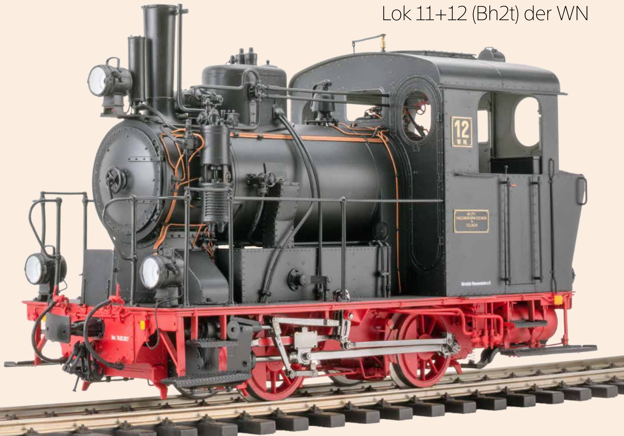
Lok 11+12 (Bh2t) der WN