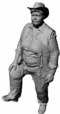
Western Wanda Art. 480178A / 400178B