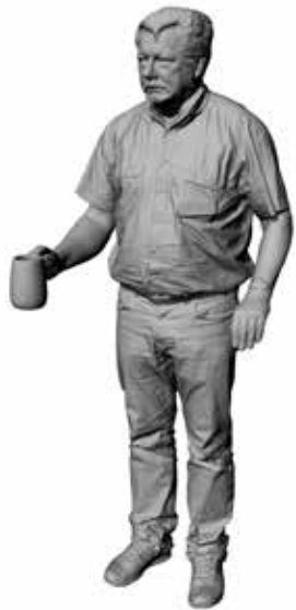
Durstiger David Art. 480189A / 480189B