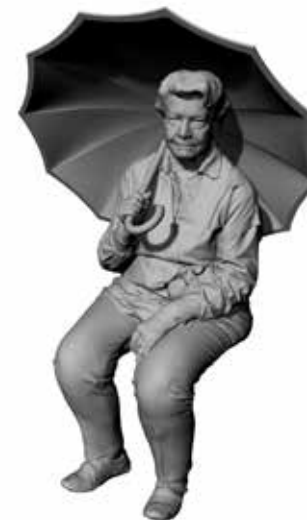
Regenschirm Renate Art. 480180A / 480180B