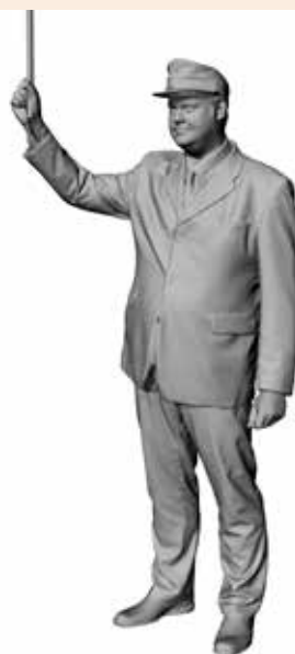
Schaffner Schorsch Art. 480183A / 480183B