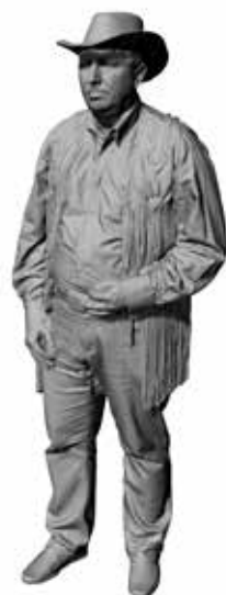
Western Willy Art. 480179A / 480179B