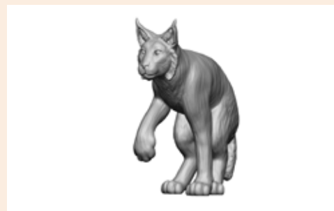
Luchs Lea Art. 480027