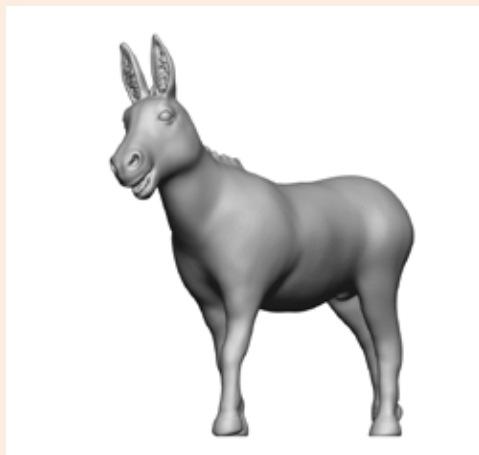
Esel Ernie Art. 480020