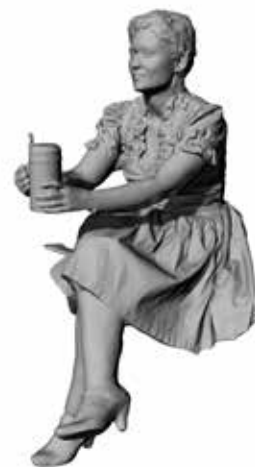
Fesche Franzi Art. 480194A