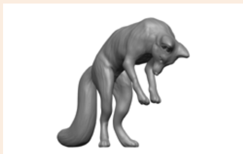
Fuchs Falko Art. 480026