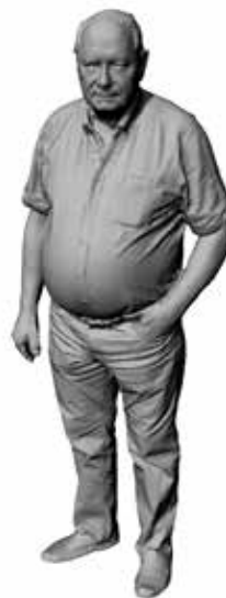
Reisender Reinhard Art. 480185A / 480185B