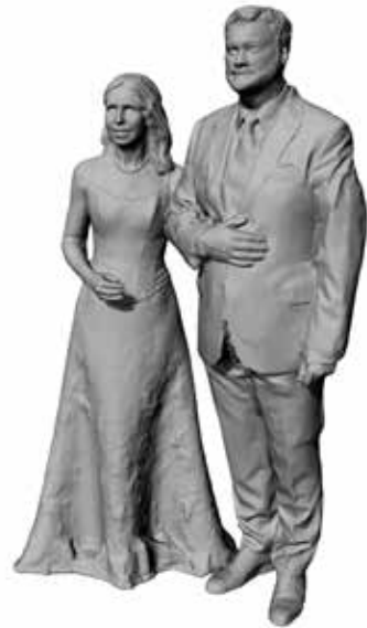
Brautpaar Art. 480100-1