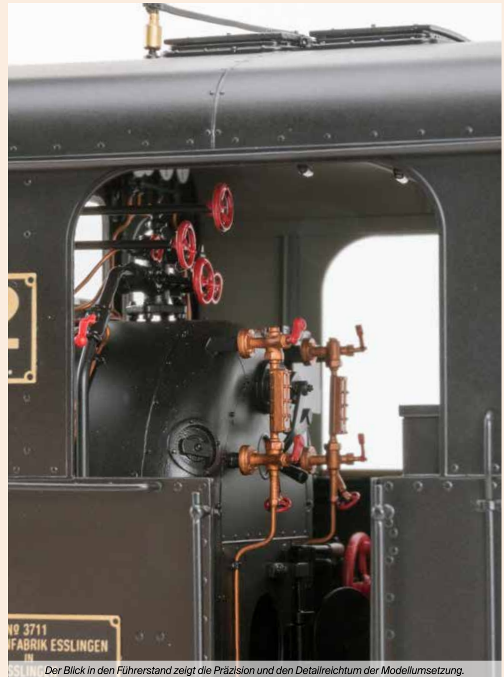
Der Blick in den Führerstand zeigt die Präzision und den Detailreichtum der Modellumsetzung.

Erhältlich in 11 verschiedenen Varianten Art. Nr. 181101 bis 181111, siehe aktuelle Preisliste und Homepage.