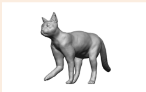
Katze Kitty Art. 480024