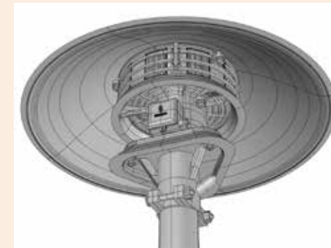
Einheitssirene E57 Art. 480660

Noch heute ist diese Sirene in vielen Städten teils auf Häuserdächern verbaut und dient inzwischen meist zur Feueralarmierung. Ein schönes und hochwertiges Modell, das durch seine filigrane Detaillierung besticht. Bauen Sie nicht nur eine Feuerwehr, sondern sorgen Sie mit diesem Detail und unserem Scenic-Sound-Modul für noch mehr Vorbildtreue im Modell.