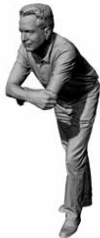
Lässiger Lars Art. 480181A / 480181B