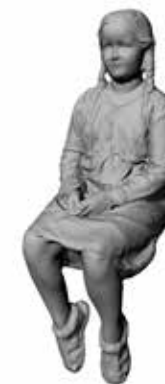
Wartende Wilma Art. 480191A / 480191B