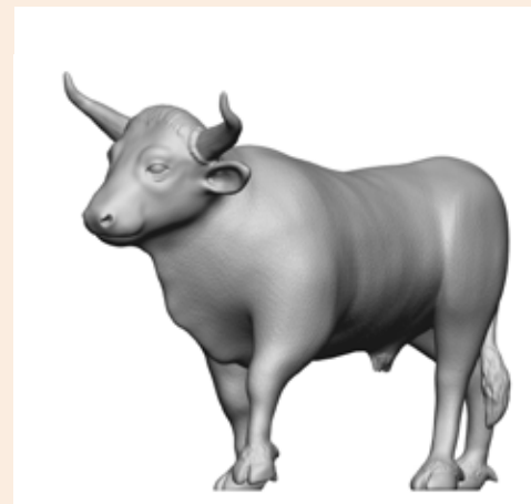
Ochse Otto Art. 480022