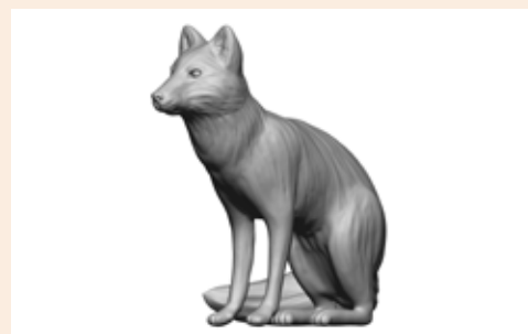
Fuchs Finn Art. 480025