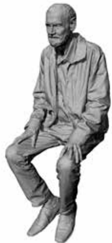
Wartender Wolfgang Art. 480184A / 480184B