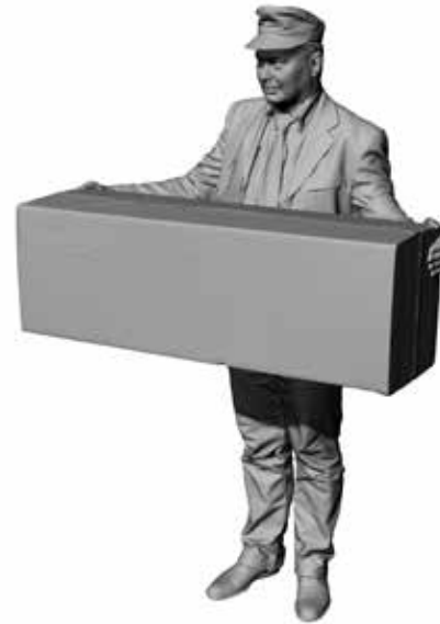
Paketbote Paul Art. 480187A / 480187B