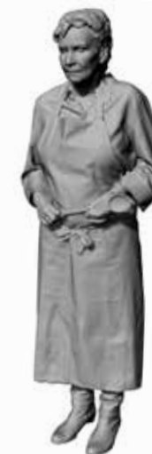
Kulinarische Karin Art. 480182A / 480182B