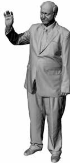
Winkender Werner Art. 480169A / 480169B