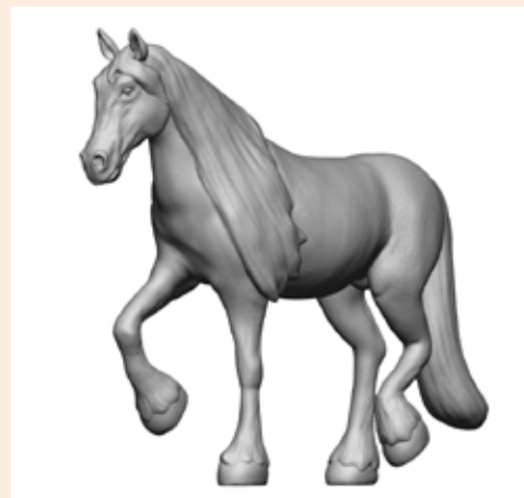
Hengst Henry Art. 480021