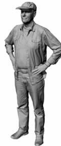
Reisender Ralf Art. 480177A / 480177B