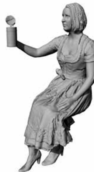
Prostende Paula Art. 480200A